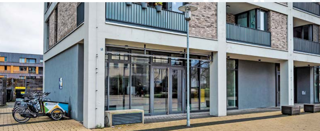
Bald wird auch diese Gewerbefläche zum Café.