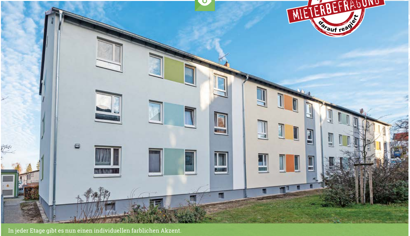
In jeder Etage gibt es nun einen individuellen farblichen Akzent.

Zum Jahresende haben wir die Modernisierung der Ludwigstraße 9 bis 10a abgeschlossen.