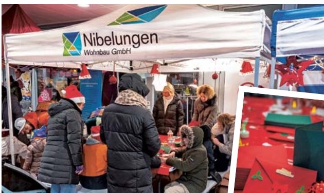
Am Stand der Nibelungen wurden beim Weststädter Weihnachtsmarkt Karten gestaltet.