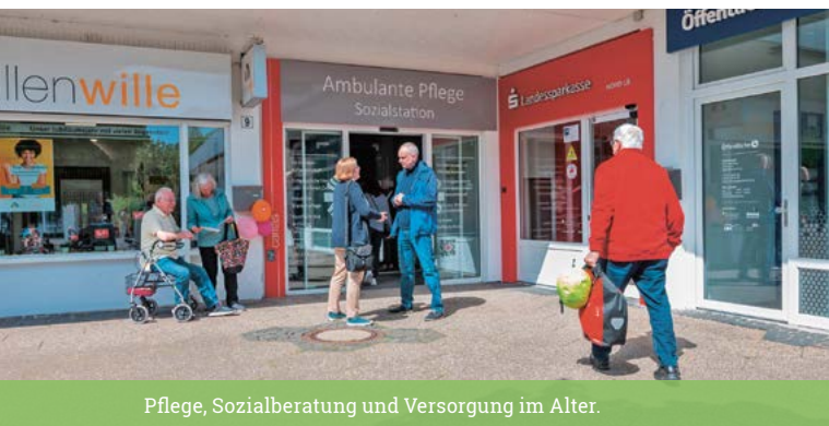
Pflege, Sozialberatung und Versorgung im Alter.