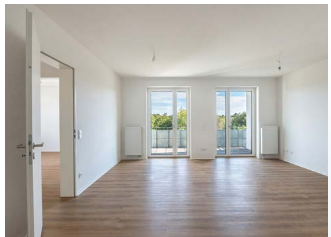
73 neue Wohnungen sind bezugsfertig.

In der Straße Berghey gestalten wir insgesamt 19 öffentlich geförderte Wohnungen. Der Bau des energieoptimierten KfW-Effizienzhauses 55 EE wird mit Mitteln der KfW-Bank gefördert. Eine Effizienzhaus EE-Klasse wird erreicht, wenn erneuerbare Energien einen Anteil von mindestens 55 Prozent des für die Wärme- und Kälteversorgung des Gebäudes erforderlichen Energiebedarfs erbringen. Über den Baufortschritt und die Ausstattung werden wir 2025 ausführlich berichten.