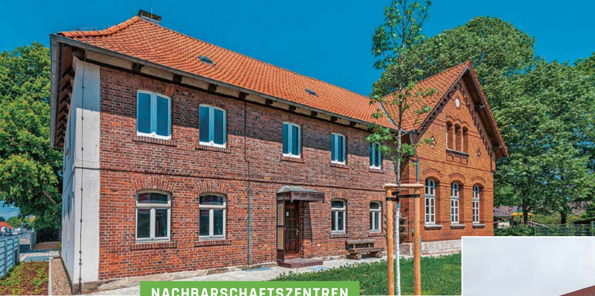
Das Gemeinschaftshaus in Rühme (links) und das bisherige "Siegfrieds Bürgerzentrum" (unten)